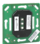
Einbau in 55-mm-Gerätedose