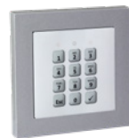
RFID-Tastatur-Schreib-Leser TR-1 MK mit Abdeckrahmen (Alu) für das Schalterprogramm GIRA