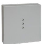
Einbau in Siedle Vario System